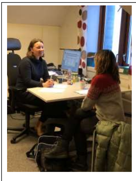
Klientmøte hos Gatejuristen Tromsø

Alle våre klienter har eller har hatt et rusproblem. Av de 639 sakene vi behandlet i 2018 hadde klienten uføretrygd i 221 saker, AAP i 164 saker og økonomisk sosial stønad i 55 saker. Bare i 57 saker hadde klienten arbeidsinntekt. Dette viser at de fleste av Gatejuristens klienter tilhører en del av befolkningen som har begrensende økonomiske ressurser. Mange sliter i tillegg med psykiske og somatiske sykdommer.