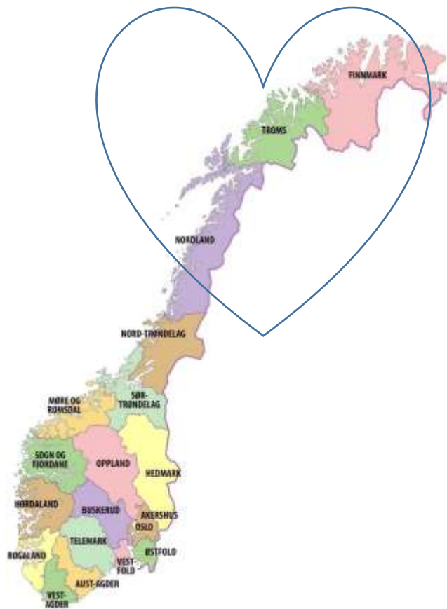
Gatejuristen Tromsøs nedslagsfelt