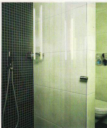
Bakveggen i dusjnisen har mosaikkvarianten av gulvflisen. En spesiallaget glassdør har hengsler som slår begge veier, veldig praktisk på små rom. Blandebatteri fra Vola.