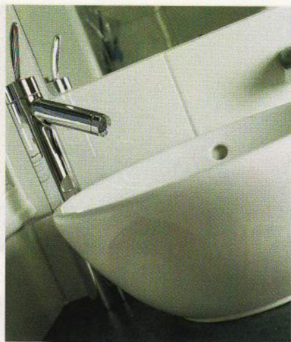
Vasken er fra Villeroy & Boch med blandebatteri fra Philippe Stark. Skiferplaten er i "Pillarguri" og har samme grånyanse som gulvet.