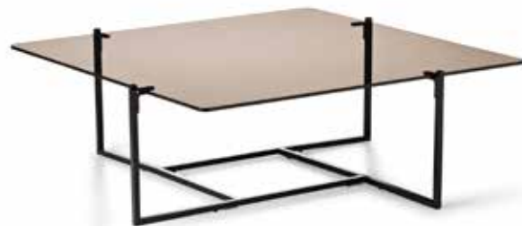
UTVALG: Glassbord Pole fra Eilersen. Rundt bord med nette ben fra Mater.