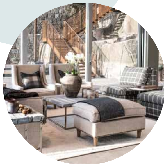
STRØKENT: Klassisk eleganse, og mer enn nok plass. Alle møbler fra Artwood.

– Stadig flere går vekk fra det massive og høye stuebordet, desserten tar vi ved spisebordet, så stadig færre har behov for å dekke på til kaffe og kaker til tolv ... Til drinker trenger man jo ikke så stor plass, derfor synes jeg det blir fint med en blanding av større og mindre bord, eller puffer, det letter også inntrykket. Sett gjerne også småbord mellom stoler. På en puff kan man sette et brett, slik at det også fungerer som bord, når man ikke har behov for den ekstra sitteplassen.