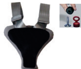
Sikkerhetspad for spenne