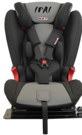
IPAI REHA-NXT grå/svart