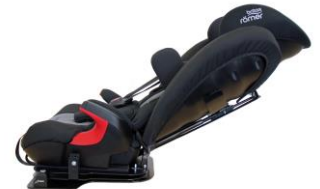
Trinnvis regulering av rygg