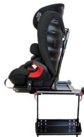
Dreieplate (standard) og fotplate (tilbehør)