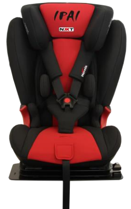
IPAI REHA-NXT rød/svart