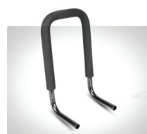
Körbygel stl. 2