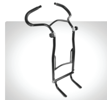
Körbåge - Zitzi Frames