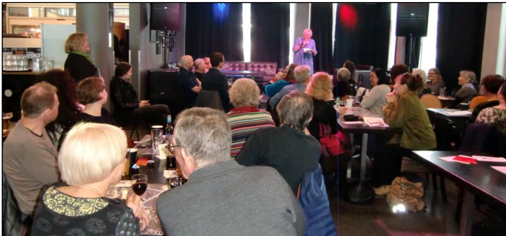
Litterær Salong på City Scene i Alta, 29.4.2017.