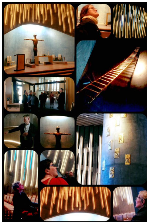
Nnf på besøk i Nordlyskatedralen, Alta.