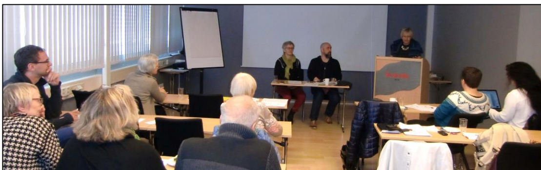
Årsmøte på Scandic Alta, 30. april 2017.