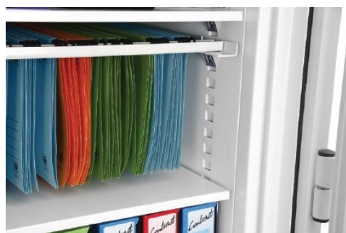
Hengemapperammer (ikke uttrekkbare)