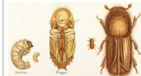
Larve, puppe og utvokst granbarkbille.

En rapport fra NIBIO melder at barkbillefangstene viser en økning i de fleste fylkene i 2018 etter den varme sommeren. Billeangrepet på 1970-tallet var resultat av tørke over flere påfølgende år, kombinert med mye vindfall. Værforholdene de kommende årene vil trolig bli avgjørende for om vi får en epidemi eller ikke, melder NIBIO i en rapport om granbarkbilen.